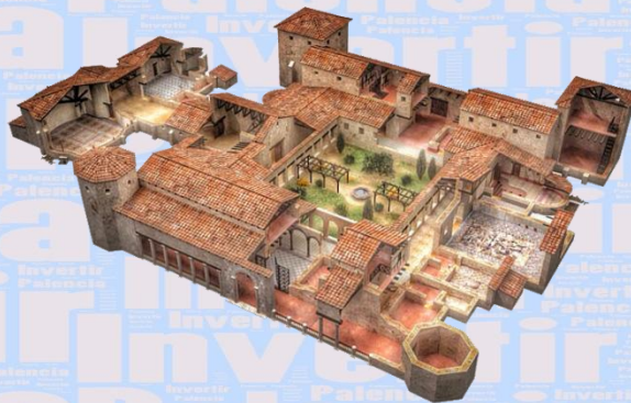
Imagen y turismo

También del medioevo llegan las fiestas populares y romerías que pueblan el calendario.